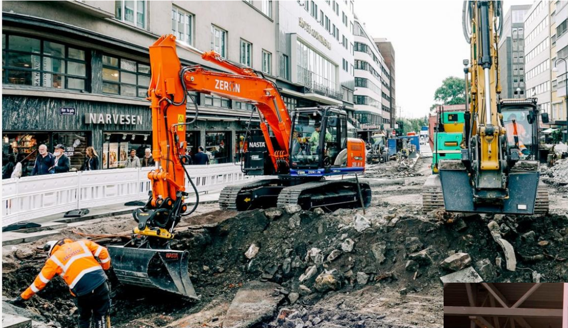
På anleggsplassen i Olav Vs gate og den østlige delen av Klingenberggata i Oslo brukes de elektriske anleggsmaskinene.