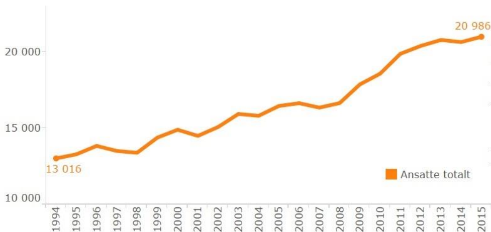
Figur: Ansatte i departementene og direktoratene